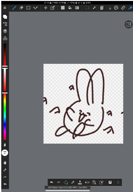
그릴 표현의 스케치