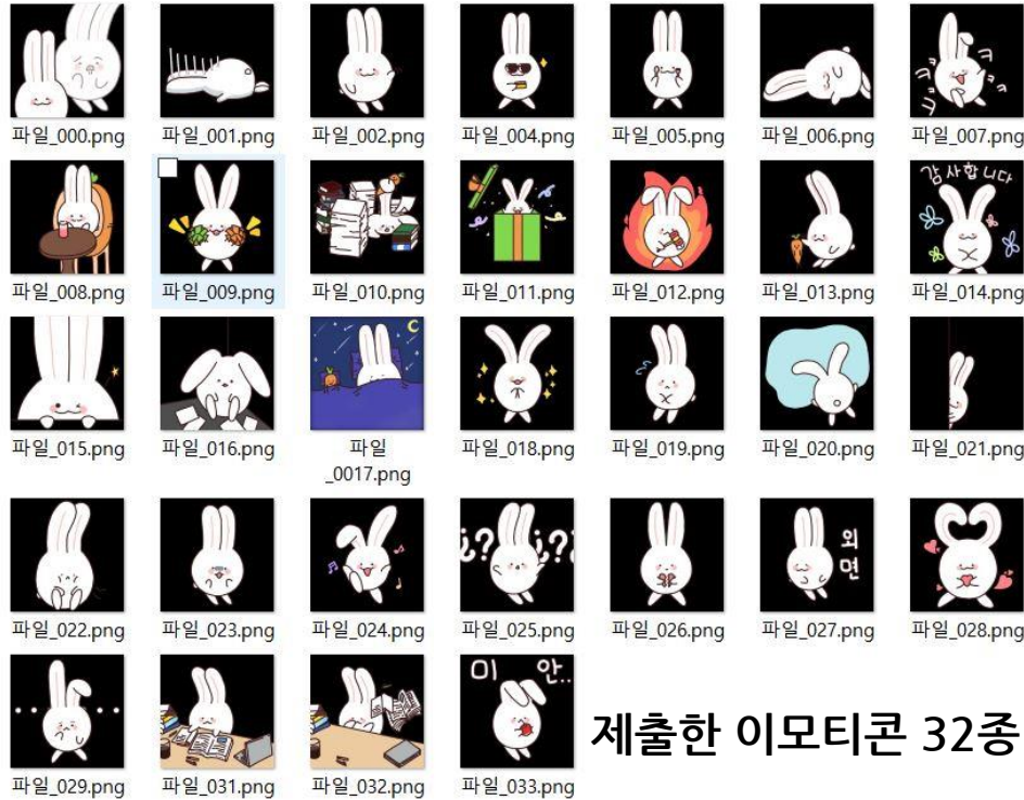
제출한 이모티콘 32종